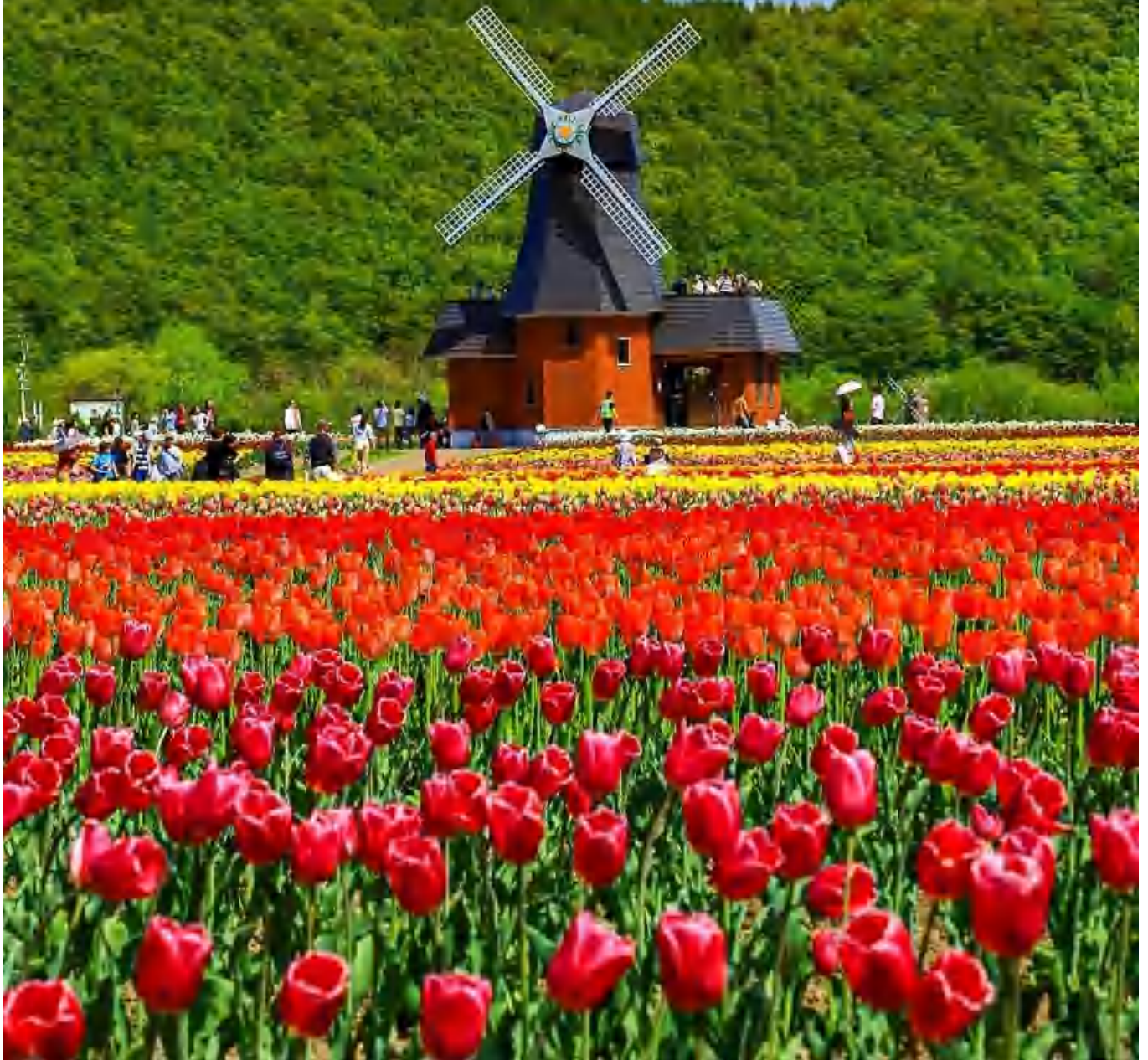
かみゆうべつチューリップ公園