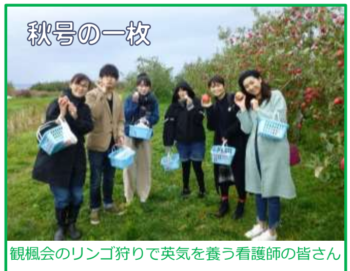
観楓会のリンゴ狩りで英気を養う看護師の皆さん