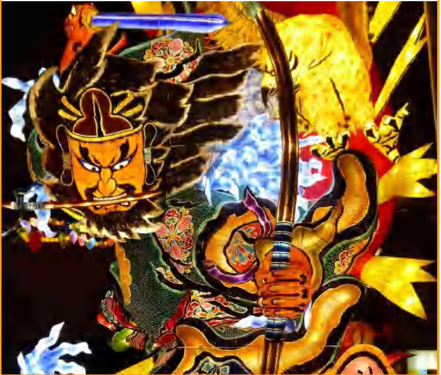
青森県五所川原市 『立佞武多の館』に展示されている【神武天皇 金の鶉を得る】の立佞武多 全高 23m